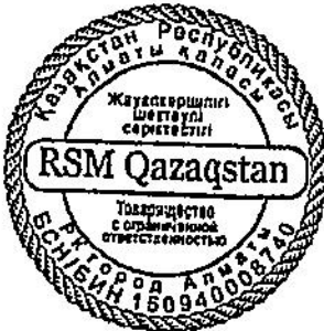
Дильшат Курбанов Аудит бойынша серіктес

050010, Қазақстан Республикасы, Алматы қ. Достық дағ., 43, «D43» бизнес орталығы, 302 кеңсе